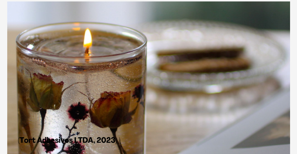
Velas de gel