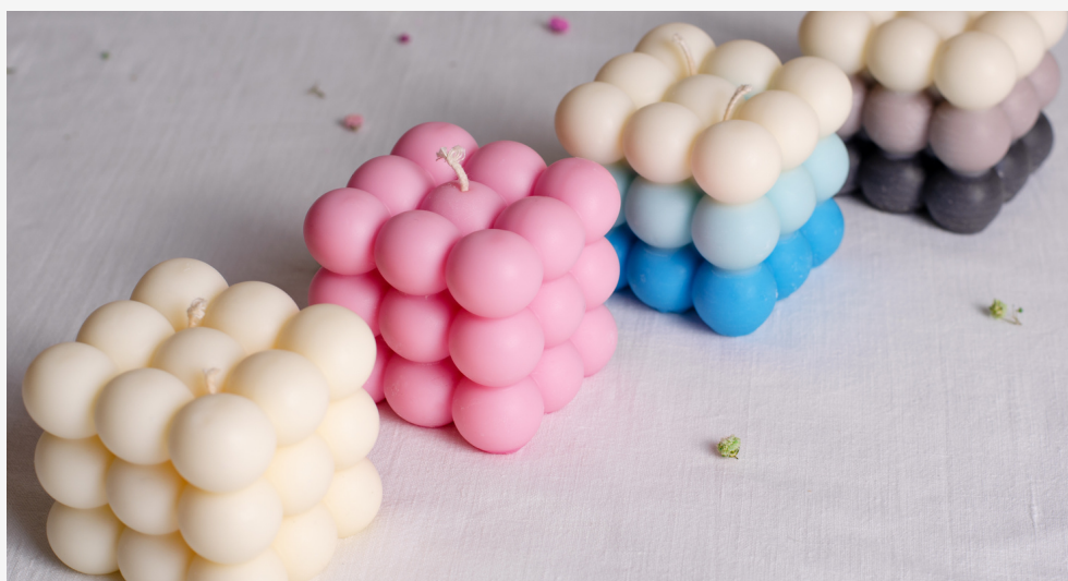
Velas a cera de parafina