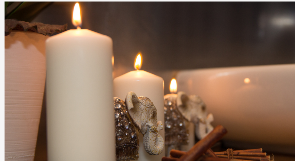
Velas de pilar