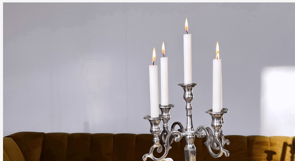
Velas de candelabro